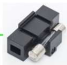
Netzsicherungshalter mit Feinsicherung Fuse holder with assembled fuse

Achtung: Bei einem Sicherungswechsel unbedingt zuvor das Netzkabel vom Netz trennen!